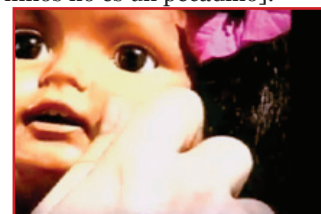
Imagen de la película austríaca.

Austria Airlines pone una película en vuelos largos a la India y Sudáfrica, titulada The abuse of children is not a peccadillo [El abuso de niños no es un peccadillo].