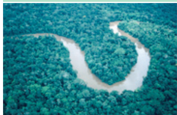
El Río Amazonas de Brasil y la deforestación de la zona. ( http://travel.mongabay.com/pix/peru/aerial-rainforest-Flight_1022_1553.html )

Ver "Forest Up in Smoke" [La selva se hace cenizas] en: http://youtube.com/skin_slj2y