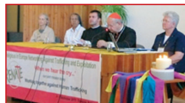
(Above) Panel of presenters at the Renate Conference.

( http://www.globallabourrights.org/admin/documents/files/110914-IGLHR-Press-Kit-Yet-Another-Victim-Comes-Forward-at-Classic.pdf )