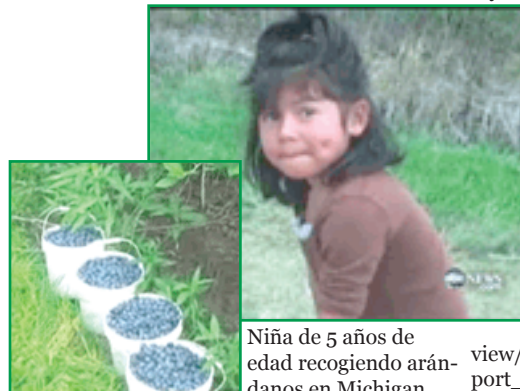
Niña de 5 años de edad recogiendo arándanos en Michigan