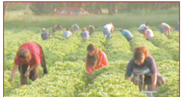
Niños trabajando en los EE. UU. ( http://vimeo.com_6610039 )

La mayoría de los países ya cuenta con leyes y políticas en materia de trabajo infantil y trata de personas, que se deben mejorar para cumplir con los estándares internacionales. Es necesario desarrollar diversos mecanismos de frenos y contrapesos contra las malas prácticas. Se debe también potenciar al máximo la cooperación nacional e internacional para contrarrestar el trabajo infantil y la trata de niños. (Vea también la pág. 5 CRC)