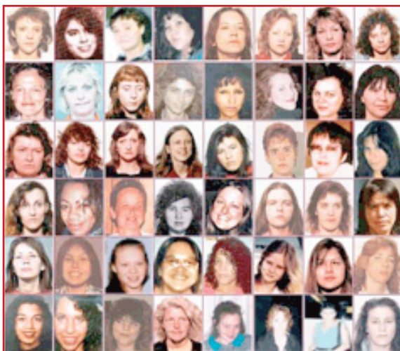
Missing Vancouver women.

El informe de Amnistía Internacional de Canadá del año 2004, Stolen Sisters [Hermanas robadas], indica que los líderes indígenas y defensores de las mujeres se han quejado por años de que las autoridades canadienses estaban ignorando en gran parte sus informes reiterados acerca de las mujeres indígenas desaparecidas. Defensores en Canadá y los Estados Unidos afirman que la mayoría de las víctimas traficadas tienen historias relacionadas con abuso sexual. El informe de 2007 de Amnistía Internacional , Maze of Injustice [Laberinto de injusticia], descubrió que una de cada tres mujeres indígenas será víctima de abuso sexual en su vida: la tasa más alta de todas las etnias. Esa alta tasa de violación contribuye a la normalización e internalización del estado de víctima, convirtiendo a las mujeres y las chicas indígenas en presas fáciles para los traficantes. Las atraen a este modo de vida con regalos, salidas de compras, alcohol y drogas. El mundo del tráfico sexual es terriblemente violento. Una vez acabado el proceso de preparación, el tono cambia a «Me debes una. Necesito que hagas esto por mí». Luego empieza la esclavización. ( http://www.dailyonder.com/sex-trafficking-home/2010/10/13/2989 )