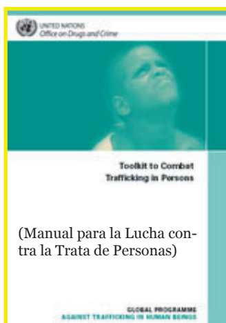
(Manual para la Lucha contra la Trata de Personas)

El manual se encuentra en el siguiente enlace: http://www.unodc.org/unodc/en/human-trafficking/electronic-toolkit-to-combat-trafficking-in-persons---index.html