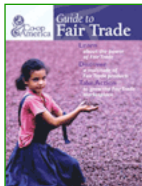
Guía de Cooperativas Estadounidenses para el Comercio Justo.

http://www.coopamerica.org/programs/sweatshops/guide