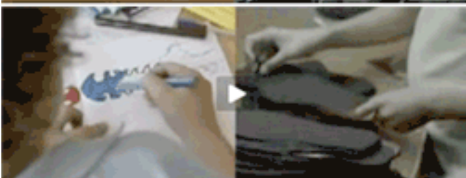
Foto de abajo: Un niño colorea un libro, después del colegio; el otro aún se encuentra trabajando en la fábrica de zapatos.

Puede ver el video en: http://www.youtube.com/watch?v=cdrCalO5BDs