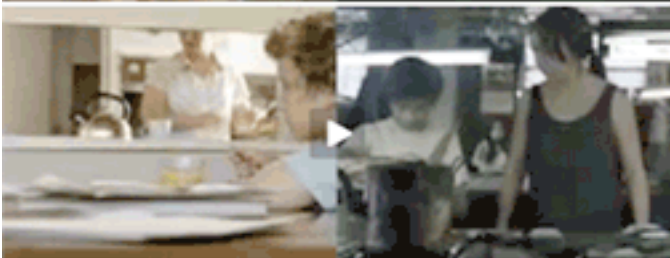
Foto de en medio: Un niño desayuna en su casa; a la misma hora, el otro ya se encuentra trabajando en la fábrica de zapatos.