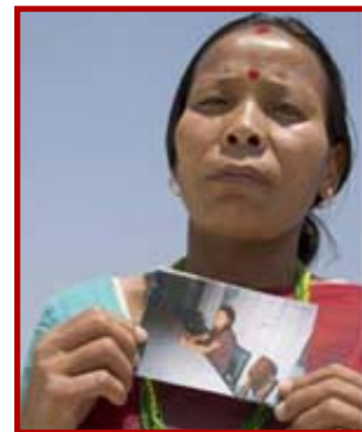
Madre nepalesa en India busca a su hija, quien fue traficada a un burdel.

En 1999, dos organizaciones no gubernamentales (ONGs) – Casa Alianza y Global March Against Child Labour , (Marcha Global Contra el Trabajo Infantil), informaron sobre la explotación sexual de menores de edad en varios hoteles en San José, Costa Rica, incluyendo el Marriott. Luego de una investigación penal, un costarricense fue condenado a ocho años en prisión por el delito de proxenetismo agravado de menores. El acusado apeló el veredicto y en 2002, la Corte Suprema de Costa Rica sobreseyó la apelación. Una declaración jurada de un testigo del juicio reveló una red de recepcionistas de hotel – incluidos recepcionistas del Marriott. Las víctimas relataron como los culpables les llevaron al Marriott y a otros hoteles para ofrecer sus servicios a los clientes.