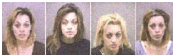
La verdadera ‘cara’ de la prostitución. (Escogido de un artículo sobre la prostitución en PRISM Set./Oct. 2007, revista de Evangélicos para la Acción Social (Evangelicals for Social Action). Crédito de la foto desconocido.

El gobierno sueco y Ekberg aplican el mismo principio, que es revelar el hombre, en sus campañas de publicidad para promover la ley contra la prostitución. “En las imágenes de la prostitución de calle, siempre hay una niña que lleva una minifalda y zapatos de tacón, con un auto al lado. Yo quería sacar al hombre del auto para que estuviera visible porque él es la razón por la cual ella está ahí en el primer lugar”, declaró Ekberg.