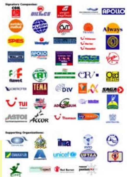
Signatarias del código

Disponible en: http://www.ecpatusa.org/documents/Signatories_COC_Condensed_2006.doc