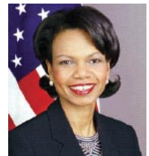
Secretaria del Estado de EEUU, Condoleezza Rice, el 3 de junio, 2005

de educación. Los países de destino o de demanda, como Estados Unidos y otras naciones prosperas, lugares en los cuales se genera el mercado del tráfico, también tienen una responsabilidad importante.”