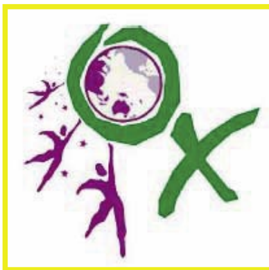
Logo del Congreso de Townsville

(Podrá obtener el texto entero en el sitio web de Australian Domestic Violence Clearing House )