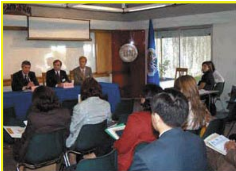
Los participantes del taller.

Según la UNESCO costaría $10 mil millones más por año garantizar que todos los niños del mundo tuvieran una enseñanza primaria básica. Los gobiernos del mundo invierten dicha cantidad de dinero en sus fuerzas armadas cada cuatro días.