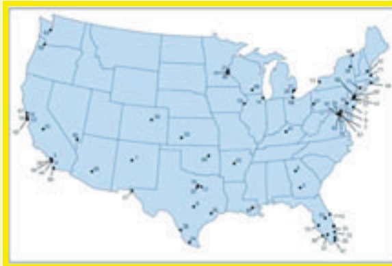
Lugares mencionados en el informe donde se llevan a cabo los trabajos forzados.