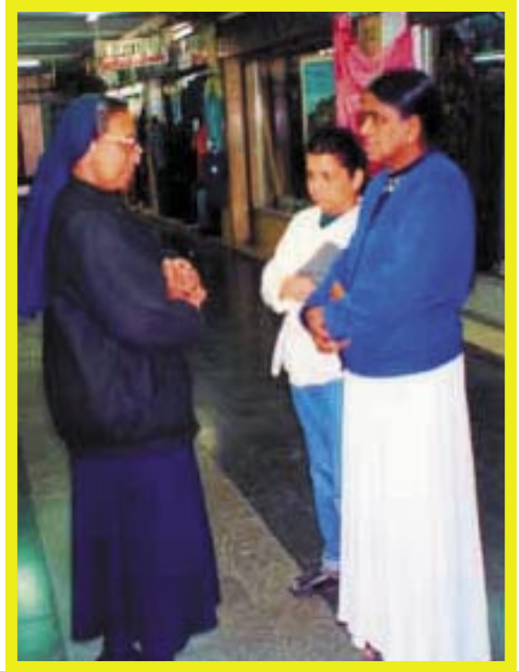
S. Concy SDS habla con unas criadas ceilandesas que trabajan en Aman, Jordania

¡Nos sentimos casi como Moisés cuando le dijo al faraón que librería a su pueblo!